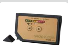
ダイヤモンド判定器

これ1台で、天然ダイヤモンド、CVD/HPHT合成ダイヤモンド、モアサナイト、CZ、その他の類似石が判定できます