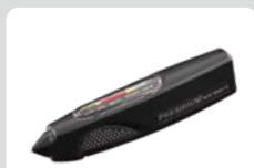
モアサナイト判定器