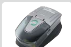
合成ダイヤモンド判定器